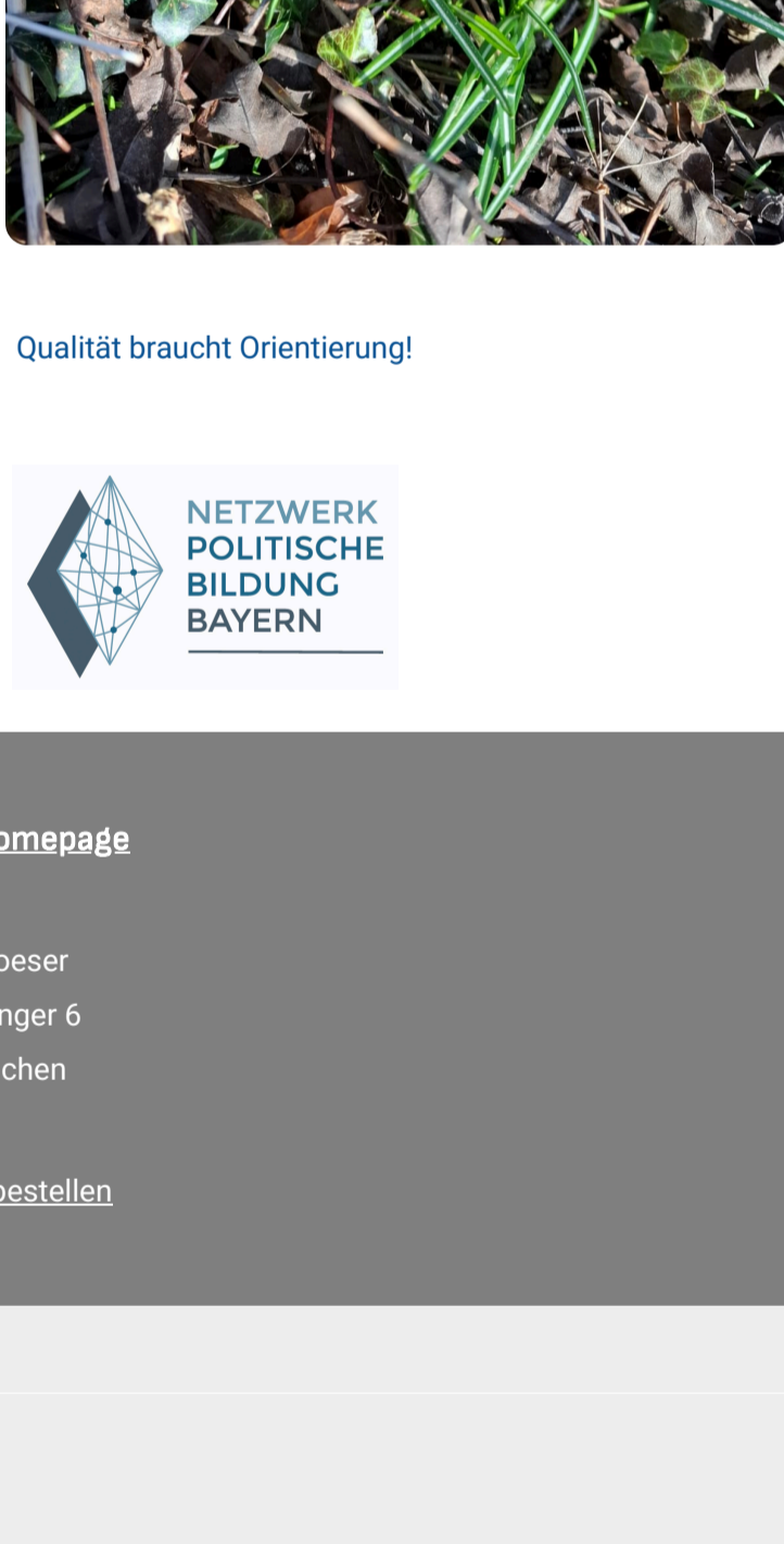
Qualität braucht Orientierung!

5. Was könnte Ihnen helfen, im Spannungsfeld zwischen Orientierung und Vielfalt eine gute Balance zu finden?