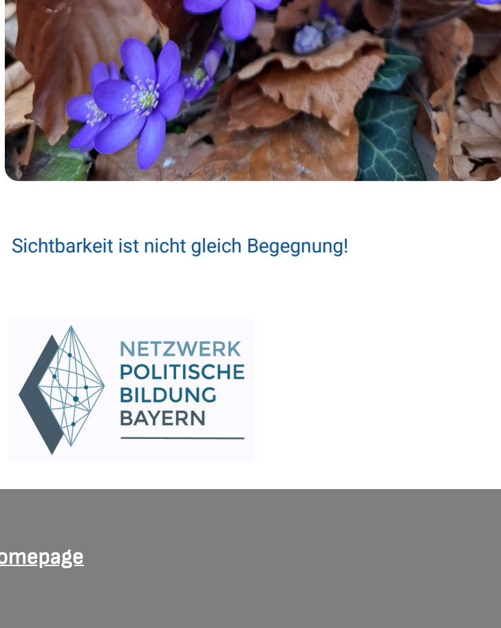
Sichtbarkeit ist nicht gleich Begegnung!

5. Was brauchen Sie selbst, um zwischen Austausch mit anderen und eigener Reflexion eine gute Balance zu halten?